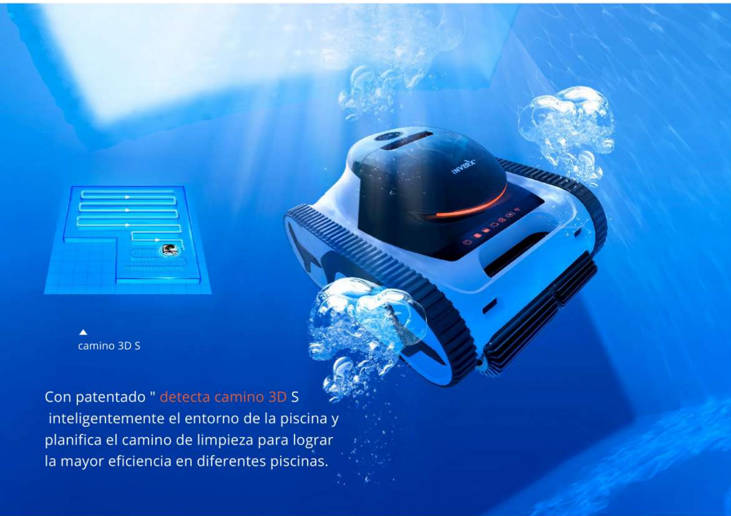
▲ camino 3D S

Con patentado " detecta camino 3D S " inteligentemente el entorno de la piscina y planifica el camino de limpieza para lograr la mayor eficiencia en diferentes piscinas.